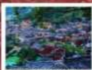
หมู่บ้านแม้วชียง