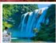
น้ำตกหวงกิ้วซู