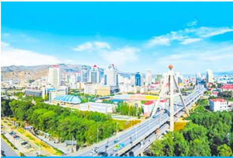
เมืองซีหนิง