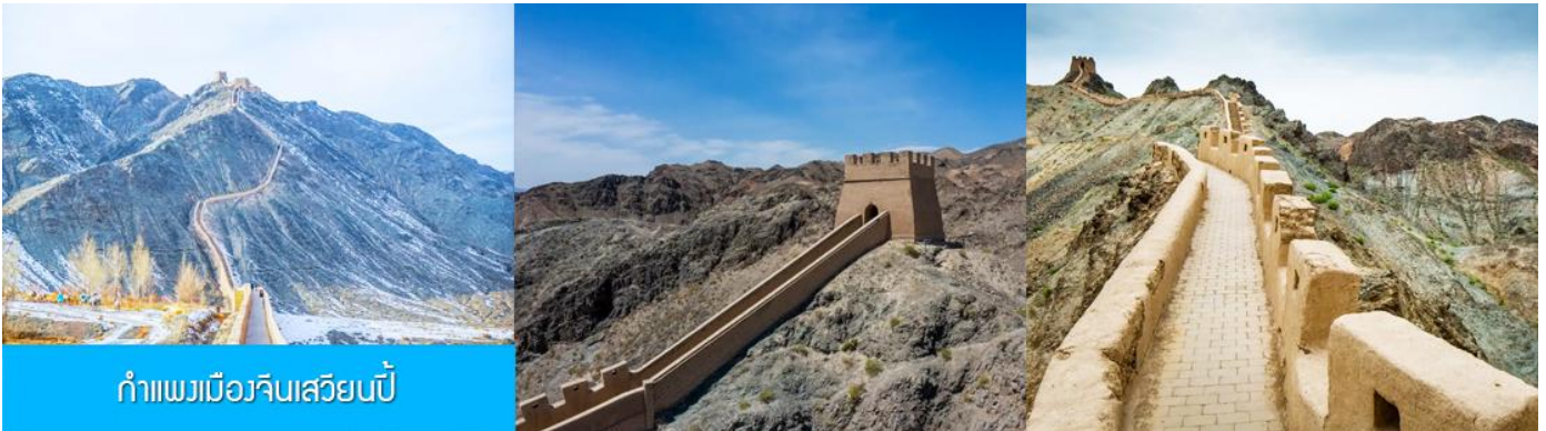
กำแพงเมืองจีนเสวียนปี้