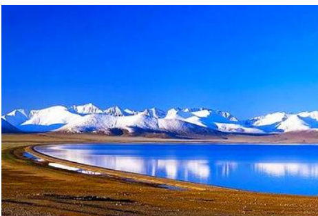
ทะเลสาบชิงไห่ใหญ่