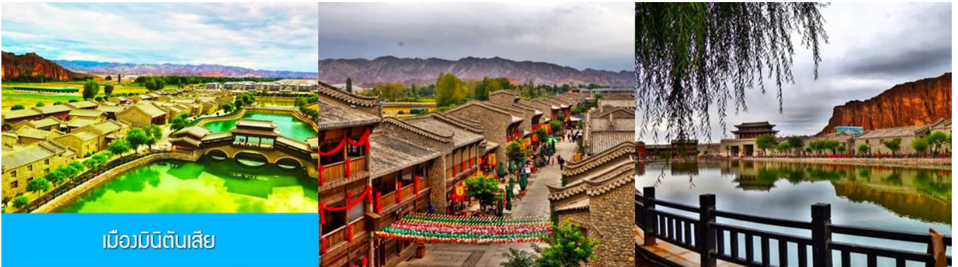
เมืองมินิดินสี