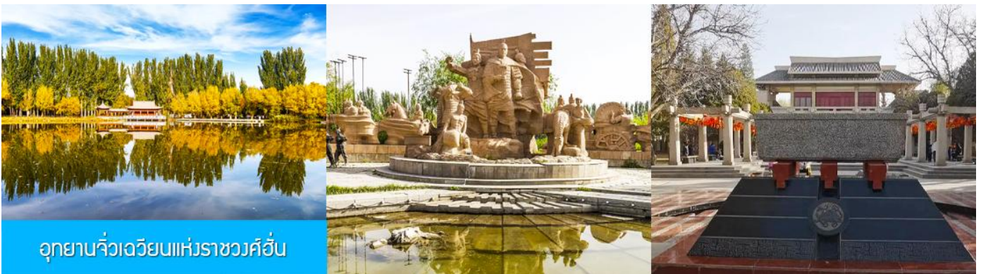
อุทยานจิวเจวียนแห่งราชวงศ์ฮั่น

จากนั้นนำท่านเดินทางสู่เมืองจิวเจวียน (ระยะทาง 50 กม. ใช้เวลาเดินทาง 1 ชั่วโมง)