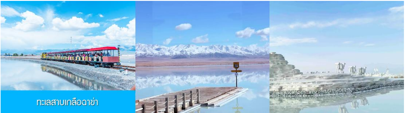
ทะเลสาบเกลือฉาซ่า

หลังอาหารนำท่านเดินทางโดยรถบัสสู่ทะเลสาบฉาซ่า (ระยะทาง 289 กม. ใช้เวลาเดินทางราว 3 ชั่วโมงเศษ)