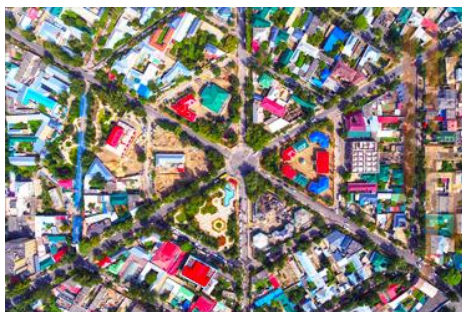
ถนนหกแฉก

จากนั้นนำท่านเดินทางสู่ เมืองอิหนิง 伊宁 (ระยะทาง 200 กม. ใช้เวลาเดินทางราว 3 ชั่วโมง)