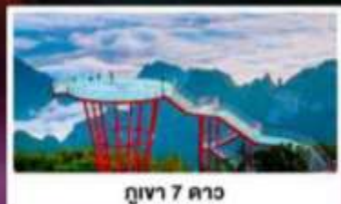
กุเวา 7 ดาว