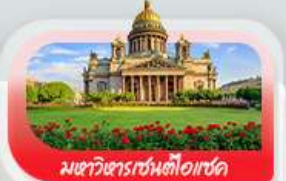
มหาวิหารเซนต์ไอแซค