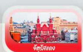
จัตุรัสแดง