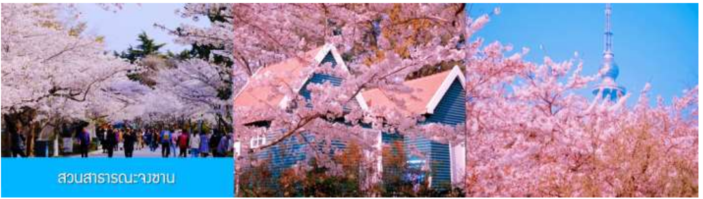
สวนสาธารณะจางชาน

ถึงชิงเต่า นำท่านชมสวนสาธารณะจางชาน สวนจางชานได้ขึ้นชื่อว่าเป็นสวนที่ชมซากุระสวยที่สุดในเมืองชิงเต่า พอถึงช่วงดอกบาน ต้นซากุระสองข้างทางจะผลิบานพร้อมกัน กลายเป็นอุโมงค์สีชมพูขาว เดินเข้าไปในสวน แล้วบรรยากาศคือหวานละมุน และดูโรแมนติก จะบานช่วงปลายมีนา ถึง ต้นพฤษภาคม