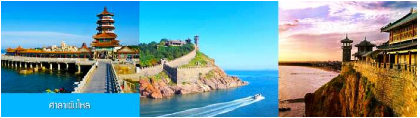
ศาลาเพิ่มไหหล

หลังอาหารนำท่านเดินทางสู่เมืองฝิงไหหล ชม ศาลาฝิงไหหล ดินแดนแห่งเทพเซียน และเป็นหนึ่งในสี่สถานปัตยกรรมโบราณที่งดงามของจีน ซึ่งตั้งอยู่ริมทะเล ( ชมด้านนอก )