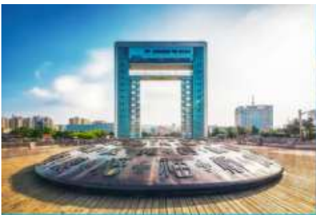
ประตูแห้วโชค