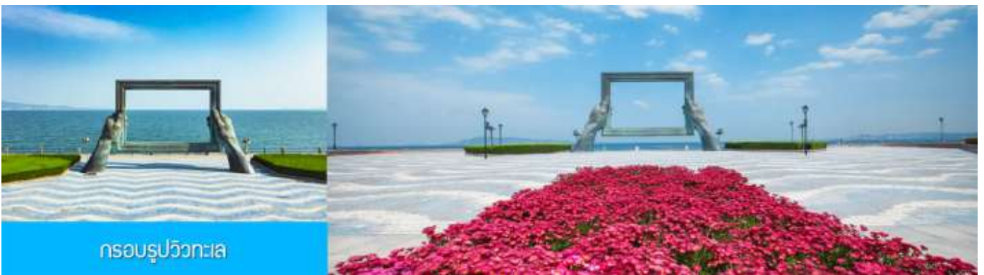
กรอบรูปวิวทะเล

พักที่ Holiday Inn Express Hotel หรือ ระดับมาตรฐาน 4 ดาว ท้องถิ่น