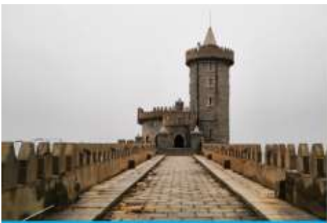
คาเฟ่อีสอง