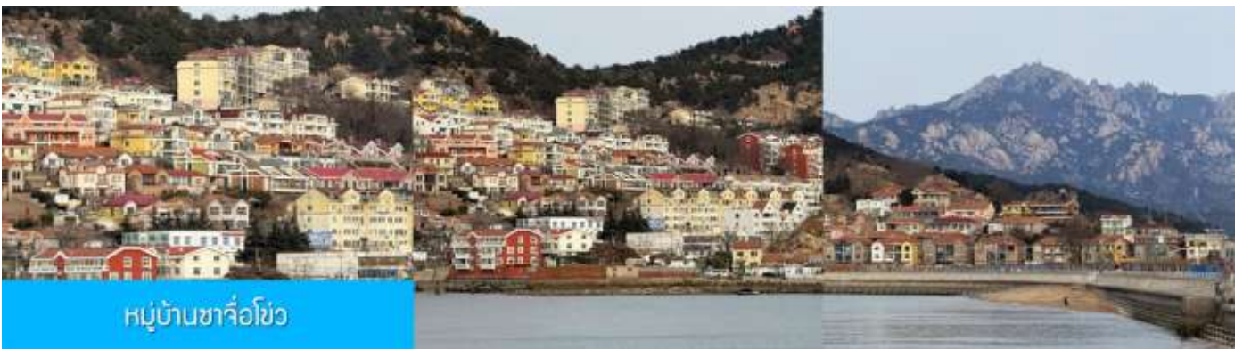
หมู่บ้านซาจื่อโขว

เที่ยง รับประทานอาหารกลางวัน ณ ภัตตาคาร (มื้อที่ 7)