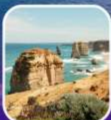
Great Ocean Road (ครึ่งสาย)