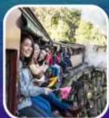
รถไฟจักรไอน้ำโบราณ