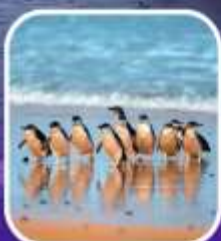
เพนกวินที่เกาะฟิลลิป