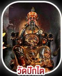
วัดบิกไค