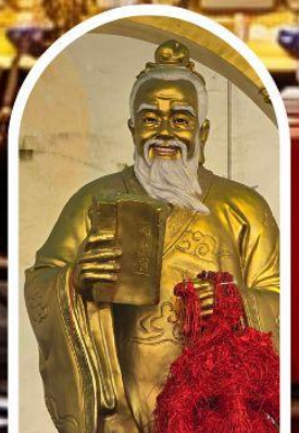
วัดหวังต้าเซียน ขอพรสุขภาพ ความรัก