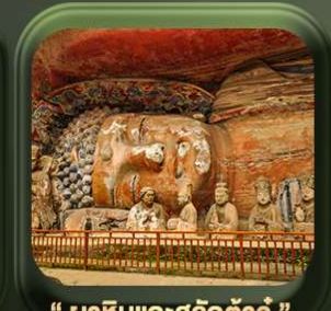
“ พาหินแกะสลักต้าจู้ ”