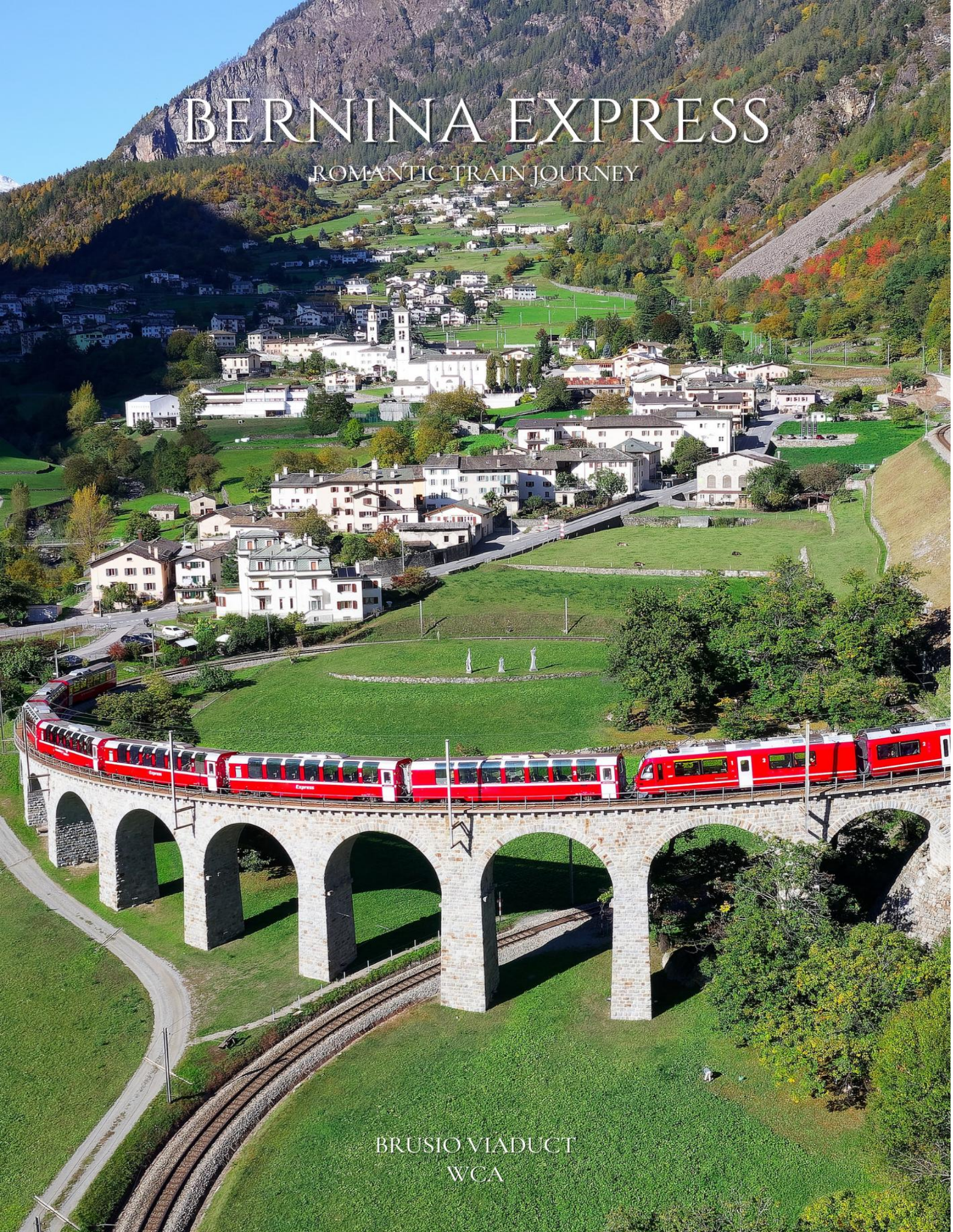
BRUSIO VIADUCT WCA