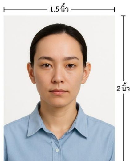
ขนาดรูปตัวอย่างใช้ยื่น Visa

*** ห้ามขีดเขียน แม็ก หรือใช้คลิปลวดหนีบัตรค้าย ซึ่งอาจส่งผลให้รูปถ่ายชำรุด และไม่สามารถใช้งานได้ ***