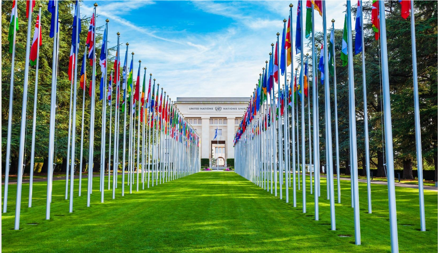
UNITED NATIONS OF GENEVA

สหประชาชาติ เจนีวา (United Nations of Geneva) เป็นหนึ่งในสำนักงานภูมิภาคที่สำคัญขององค์การสหประชาชาติ ตั้งอยู่ภายในอาคาร Palais des Nations ใจกลางนครเจนีวา ประเทศสวิตเซอร์แลนด์ อาคารแห่งนี้มีสถาปัตยกรรมแบบโรมันประยุกต์ (Neoclassical) อันโดดเด่น สร้างขึ้นในช่วงต้นคริสต์ศตวรรษที่ 20 เพื่อเป็นที่ทำการของ องค์การสันนิบาตชาติ (League of Nations) ซึ่งเป็นองค์กรระหว่างประเทศรุ่นก่อนของ