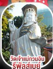
วัดเจ้าแม่กวนอิม รีพัลส์เบย์