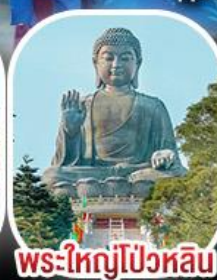
พระใหญ่โป่วหลิน