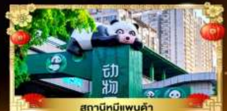
สถานีหมีแพนด้า