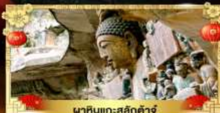
นาหินแกะสลักต้าจู่