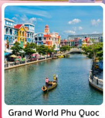
Grand World Phu Quoc