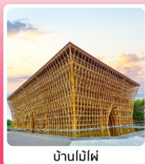
บ้านไม้ไผ่

ไอโกล์ เที่ยวครบ สวนน้ำ Aquatopia & สวนสนุก Vin Wonder เวนิสแห่งเวียดนาม Grand World Phu Quoc แลนด์มาร์คสุดโรแมนติก