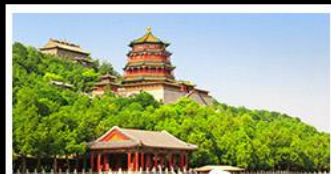
พระราชวังฤดูร้อนอี๋เหอหยวน

กำแพงเมืองจีนด่านจวิรงกวน - พระราชวังฤดูร้อนอี๋เหอหยวน สวนจิ่งอัน - วัดลามะ - ไหม่หลงร้านช้อปปิ้ง - โรงแรม 4 ดาว บ๊อพิซซเปิดปักกิ่ง สุกี่มองโก MICHELIN GUIDE ร้าน TAO TAO JU