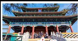
สวนจิ่งอัน