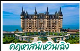
คฤหาสน์หวิบฉิง

เมืองท่าชิงเต่า - ฤดูหาสมบัติหวิบฉิง เบียร์ชิงเต่า + อาหารทะเล สตรีทอาร์ต สตูดิโอจิบลิ