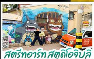
สตรีทอาร์ต สตูดิโอจิบลิ