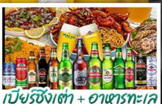
เบียร์ชิงเต่า + อาหารทะเล