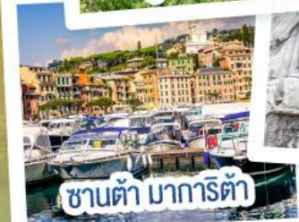
ซานต้า มารีต้า