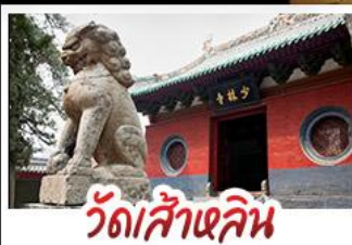
วัดส้าหลิน