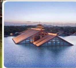
พิพิธภัณฑ์ไต้หน้ำกวงฟู่หลิน