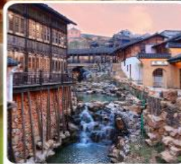
เมืองโบราณเหย่าหู