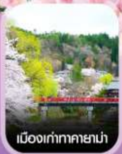
เมืองเก่าทาคายาม่า