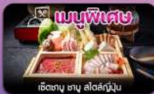
เชิตทานู ฮานู สไตส์ญี่ปุ่น

โอซาก้า-ชิราคาวาโกะ-ชมชากุระและดอกไม้บานาพันธุ์-เมืองเก่าทาคายาม่า-ซูปปังเจ้าท์เก็ต-ชินไซบาชิ-เทียวเต็มไม่มีอิสระ