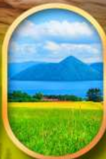
ทะเลสาบโทยะ