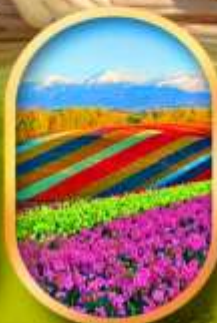
สวนดอกไม้ชิชิโซ