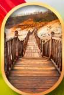
หุบเขาจิกุกดาบิ