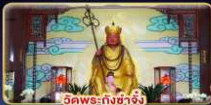
วัดพระถังซำจั๋ง