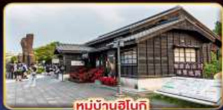
หมู่บ้านฮินเก้

"ไทเป" มหานครแห่งเมืองสีกัน เที่ยวจุใจ เช็กอินจุดไฮไลท์