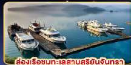
สถานีรถไฟสายสุริยอินจินตรา