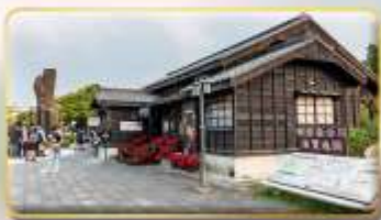
หมู่บ้านฮินกั