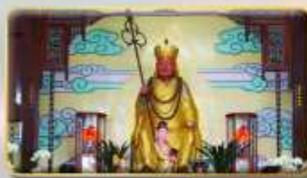
วัดพระกัซังจั้ง