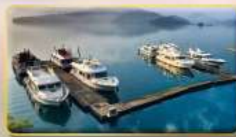
ล่องเรือชมทะเลสาบสุริยันจินทรา