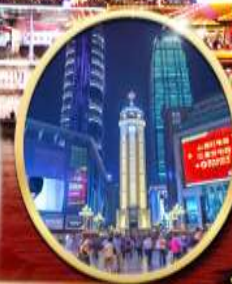
ถนนคนเดินเจี่ยฟางเป่ย์