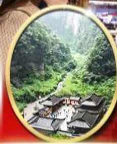
อุทยานหลุมฟ้า สะพานสวรรค์