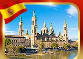
วิหารพระแม่มารีย์ ซาราโกซา