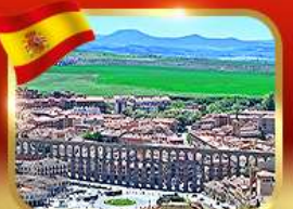
เที่ยวเมืองมรดกโลก เซโกเวีย