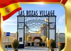
Las Rozas Village ฮากาทีลิน