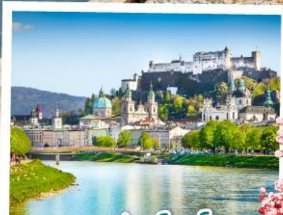
ซาคส์บวร์ค