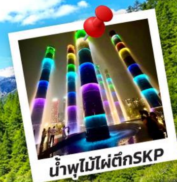
น้ำพุไม้ไฟตึกSKP

อุทยานปีผิงโกว อุทยานจิวจ้ายโกว 6วัน 5คืน