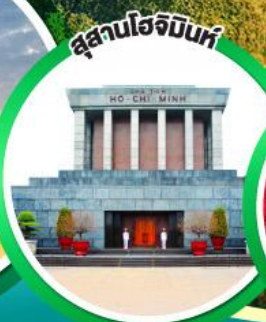
สุสานโฮจิมินห์