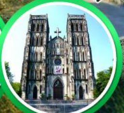
โบสถ์เซนต์โจเซฟ