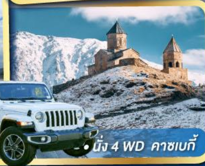
• นิ่ง 4 WD คาซเบก