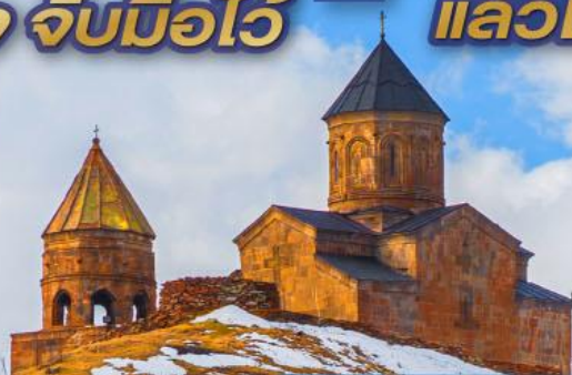
• คาซเบก โปสถ์กรนิต