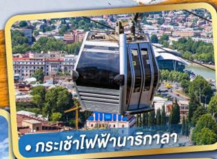
• กระเช้าไฟฟ้านาริกาลา