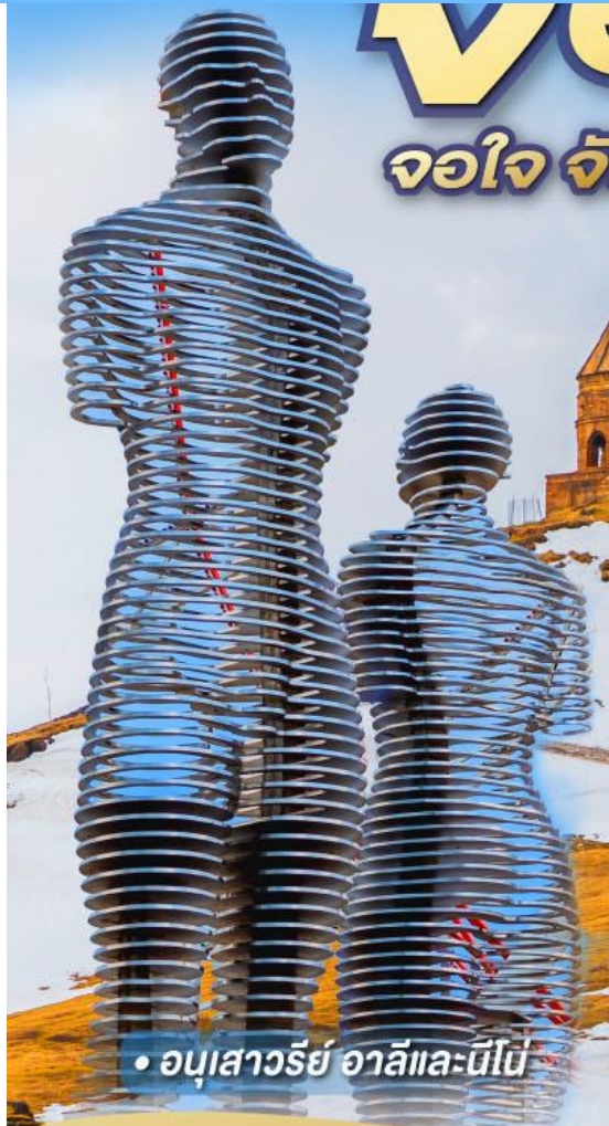
• อนุสาวรีย์ อาลีและนีโน่