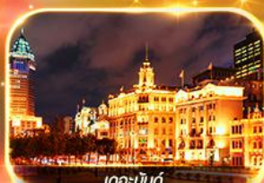
เดอะบอนด์