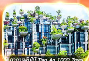
อาคารพันไม้ Tian An 1,000 Trees