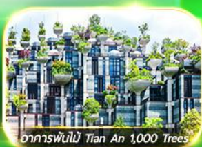
อาคารพันไม้ Tian An 1,000 Trees