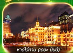
หาดไข่มุก (เดอะ บันด์)

เที่ยวมหานครเซี่ยงไฮ้ ถ่ายรูปเช็กอินที่ Tian An 1000 Trees, ซินเทียนตี้ ช้อปปิ้งตลาดเงินหวงเหมียว, ถนนนานกิง