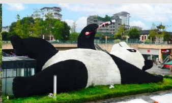
รูปปั้นหมีแพนด้าอนเซลฟี