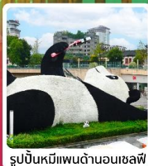
รูปปั้นหมีแพนด้าอนุเชลฟี