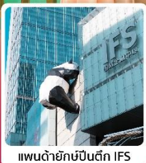
แพนด้ายักษ์ปั้นตึก IFS