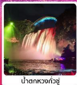
น้ำตกหวงกั๋วซู่