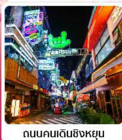
ถนนคนเดินซิงหยุน

• โฮเทล ส่วนชาคุระผิงปา หนึ่งในสถานที่ชมดอกชาคุระที่ใหญ่ที่สุดในโลก น้ำตกสวยระดับ 5A น้ำตกหวงกั๋วซู่ หมู่บ้านจีนโบราณ วูเจียงจ้าย