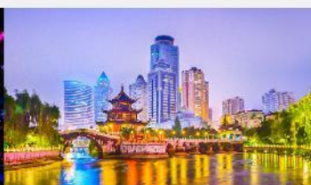
หอเจี่ยเซียวไหลว