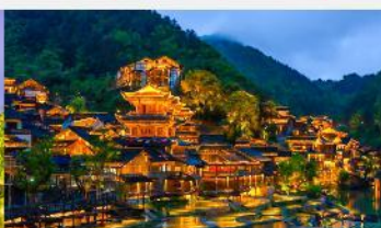
หมู่บ้านโบราณฉูเจียงจ้าย