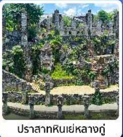
ปราสาทหินเย่หลางกู่

● โฮลท์ น้ำตกหวงกั๋วซู่ น้ำตกที่ใหญ่ที่สุดของจีน แหล่งท่องเที่ยวระดับ 5A ชมความสวยงาม หมู่บ้านเวีเจียงจ้าย หมู่บ้านจีนโบราณ