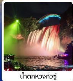
น้ำตกหวงกั๋วซู่