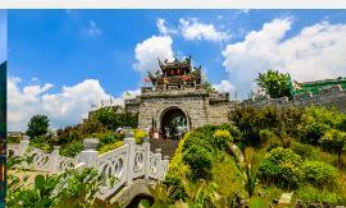
เมืองโบราณซิงเหยียน

*ทางบริษัทฯ ขอสงวนสิทธิ์ในการสลับโปรแกรมทัวร์ตามความเหมาะสมขึ้นอยู่กับสถานการณ์หน้างาน โดยคำนึงถึงผลประโยชน์ของลูกค้าเป็นสำคัญ