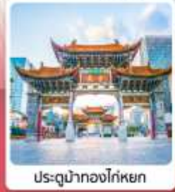
ประตูน้ำทองโก่หยก