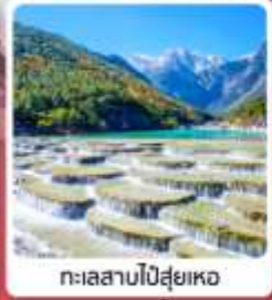
ทะเลสาบโป๋สุ่ยเหอ