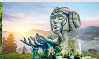
โมอาน่าคาเฟ่

*ทางบริษัทฯ ขอสงวนสิทธิ์ในการสลับโปรแกรมทัวร์ตามความเหมาะสมขึ้นอยู่กับสถานการณ์หน้างาน โดยคำนึงถึงผลประโยชน์ของลูกค้าเป็นสำคัญ