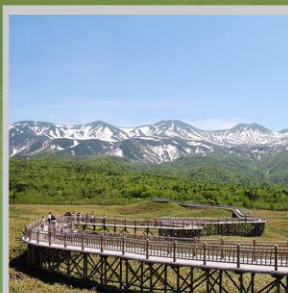
“SHIRETOKO 5 LAKES”