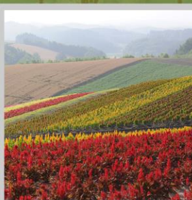
“SHIKISAI NO OKA”