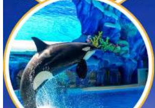
Orca Show สุดน่ารัก