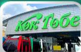
ซิมโกลโกเบชมวิวอัลมาตี

นั่งกระเช้าซิมบูลัค-ทะเลสาบโคลไซ-โบสถ์เซมคอฟ