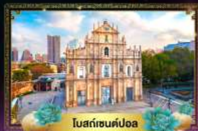
โบสถ์เซนต์ดอม