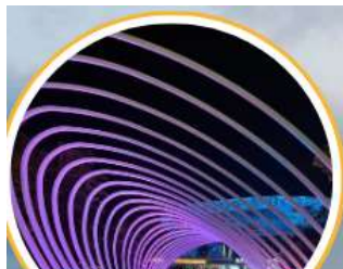
เมืองสุดล้ำเซินเจิ้น