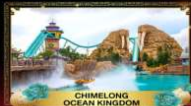
CHIMELONG OCEAN KINGDOM