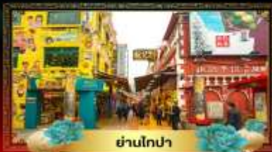
ย่านโกปา