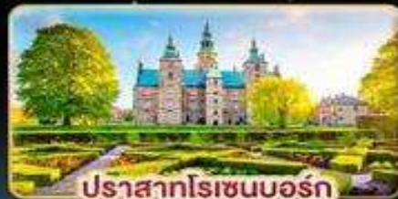
ปราสาทโรเซนบอร์ก