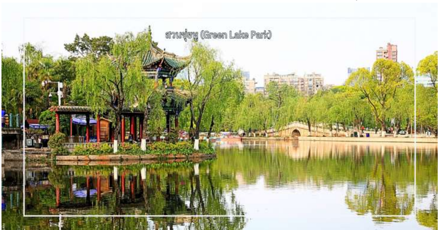
สวนชู่หู (Green Lake Park)

จากนั้นนำท่าน ชมทัศนียภาพ สวนชู่หู (Green Lake Park) เป็นสวนสาธารณะใจกลางเมืองคุนหมิงที่มีชื่อเสียงและได้รับความนิยมอย่างมาก โดดเด่นด้วยทะเลสาบสีเขียวมรกตที่โอบล้อมด้วยต้นไม้ร่มรื่น และบรรยากาศผ่อนคลาย เหมาะแก่การพักผ่อนและเดินเล่น สวนแห่งนี้เป็นศูนย์รวมวิถีชีวิตของชาวคุนหมิง นักท่องเที่ยวสามารถชมกิจกรรมท้องถิ่น สัมผัสบรรยากาศธรรมชาติ และถ่ายภาพความสวยงามของสวนในทุกฤดูกาล