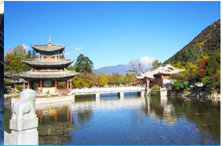
สระน้ำมังกรดำ

วันที่สาม เมืองเซี่ยงไฮ้-วัดลามะ-ช่องแคบเสือกะโจน-ลี่เจียง-คาเฟ่หยุนถึอัน-สระมังกรดำ-เมืองโบราณลี่เจียง