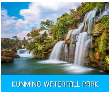
KUNMING WATERFALL PARK

นำท่านรับประทานอาหารกลางวัน ณ ภัตตาคาร (13)