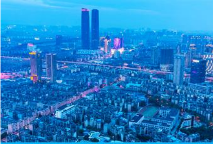
นครคุนหมิง