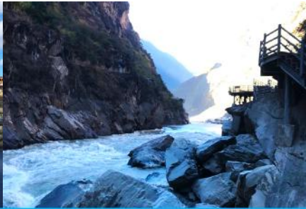
ช่องแคบเสือกะโจน