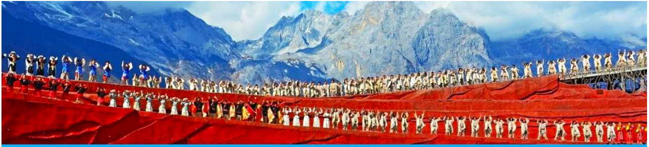
การแสดง IMPRESSION LIJIANG

ชมการแสดง IMPRESSION LIJIANG โชว์อันยิ่งใหญ่โดยผู้กำกับชื่อดังของโลก จาง อี้โหมว ได้เนรมิตให้ภูเขาหิมะมังกรหยกเป็นฉากหลัง และบริเวณทุ่งหญ้าเป็นเวทีการแสดง โดยใช้นักแสดงกว่า 600 ชีวิต แสง สี เสียง การแต่งกายตระการตา เล่าเรื่องราวชีวิตความเป็นอยู่ และชาวเผ่าต่างๆของเมืองลี่เจียง