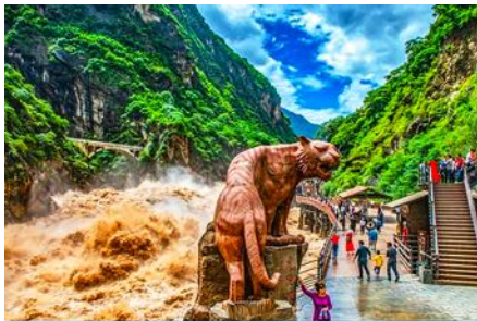
ช่องแคบเสือกะโจน