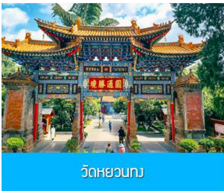
วัดหยวนทง

หลังอาหารนำท่านเดินทางสู่เมืองคุนหมิงโดยรถบัสปรับอากาศ (ใช้เวลาเดินทางประมาณ 2 ชั่วโมง)