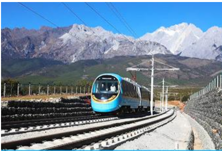
นั่งรถไฟชมวิวจากภูเขาหิมะมังกรหยก

***โปรดทราบ การแสดงนี้จัดขึ้นบริเวณลานกลางแจ้ง หากมีการงดการแสดงในวันนั้นๆ ไม่ว่าจะด้วยสภาพอากาศหรือกรณีอื่นใด ทำให้ไม่สามารถชมการแสดงได้ ผู้จัดสามารถจัดโชว์พื้นเมืองชุดอื่นมาทดแทนให้ท่านั้น โดยไม่มีการคืนค่าบริการใดๆ ทั้งสิ้น ***