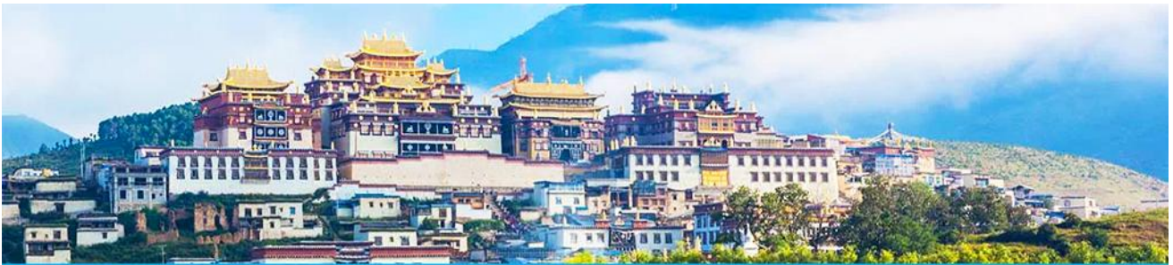
เมืองโบราณเซงกรีล่า