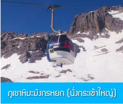
ภูเขาหิมะมังกรหยก (น้ิงกระเข้าใหญ่)

ที่พัก FENG HUANG HOTEL ระดับ 4 ดาว หรือเทียบเท่าเมืองลี่เจียง