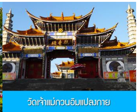
วัดเจ้าแม่กวนอิมแปลงกาย