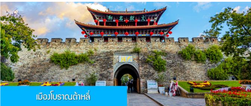
เมืองโบราณต้าลี่

พักที่ DALI ZHUANG YUAN HOTEL ระดับ 4 ดาวหรือเทียบเท่าในเมืองต้าลี่