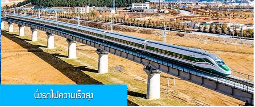
บั้งรถไฟความเร็วสูง