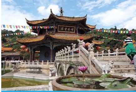
วัดหยวนทง