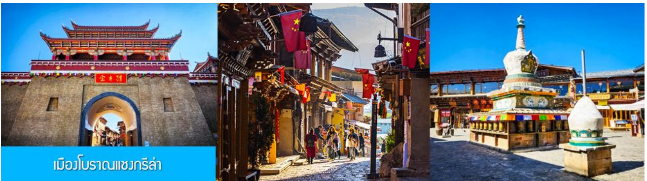
เมืองโบราณเซงกรีล่า