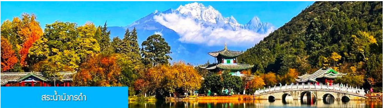
สระน้ำมังกรดำ