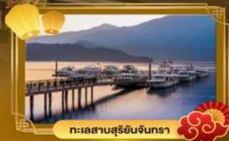
ทะเลสาบสุริยอินจันตรา