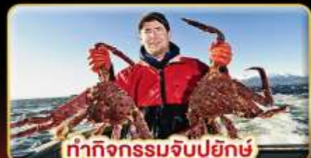
ทำกิจกรรมจับปูยักษ์ “พร้อมเมนูสุดพิเศษ”