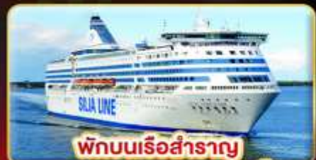
พักบนเรือสำราญ แบบ Window Room 2 คืน