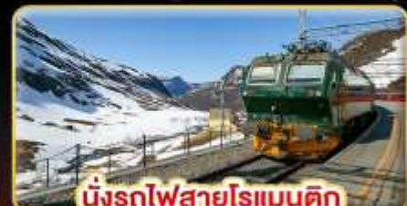
นั่งรถไฟสายโรแอมติก “พร้อมสปา”