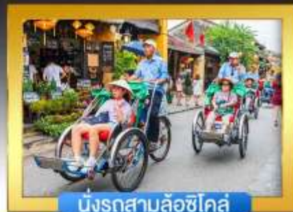
นั่งรถสามล้อซีโคล์