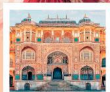
♥♦♦ Amber Fort