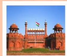
♥♦♦ Agra Fort