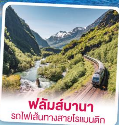
พหลิมส์บานา รถไฟเส้นทางสายโรเมนติก