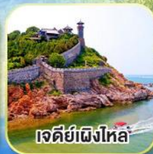
เจดีย์เฝิงไห่