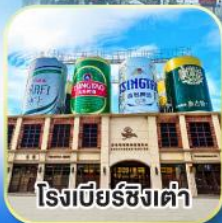
โรงเบียร์ซิงเต่า