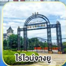
ไร่วุ้นจางยู