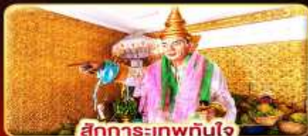
สิทการะเทพทันใจ