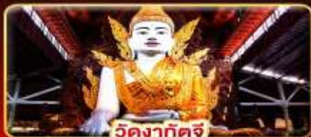
วัดงาทัดจี

สิทการะ 3 มหาบูชาสถาน พักบนอินทร์แวงน 1 คืน